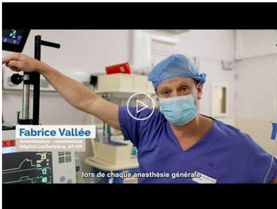
Fondation de l'AP-HP, « La Consultation Médicale Endormie : un bilan médical complet après une anesthésie. », vidéo, 2 min 42 sec, avril 2022.

En effet, la Consultation Médicale Endormie collecte des données lors d'une anesthésie pour ensuite faire bénéficier chaque patient d'un bilan de santé complet, à la sortie de son opération. À terme, la CME permettrait d'établir des prédictions de risques de développer certaines maladies neurodégénératives (par exemple, la maladie d'Alzheimer) ou cardiovasculaires (par exemple, un infarctus du myocarde). Il s'agit d'une technique de médecine prédictive . Autrement dit, par la collecte de données durant les soins normaux d'anesthésie puis leur traitement par des algorithmes dits d'« intelligence artificielle » (IA), la CME pourrait prédire l'apparition d'une maladie du cerveau ou du cœur. Si elle était généralisée, cette technique concernerait douze millions d'anesthésies par an, en France.